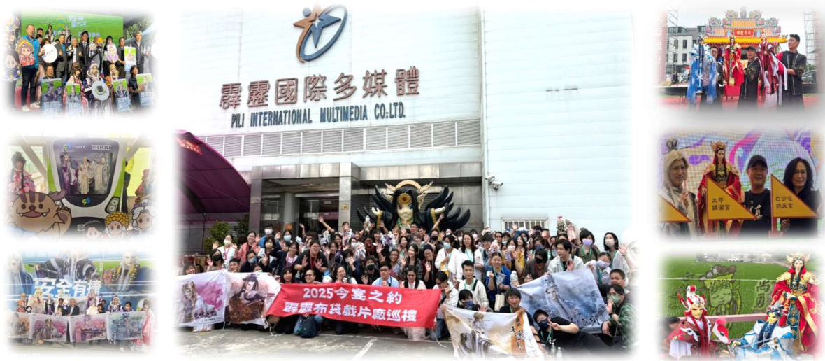
圖5-13 霹靂文化藝術傳承

霹靂國際致力於文化傳承與教育推廣，積極關懷學生學習布袋戲藝術。2025年8月10日，霹靂前進太平坪林圖書館分館，舉辦布袋戲互動活動，透過精采的表演與手作體驗，讓小朋友近距離欣賞傳統戲偶的精緻工藝與操偶技巧，並親身感受布袋戲的魅力。