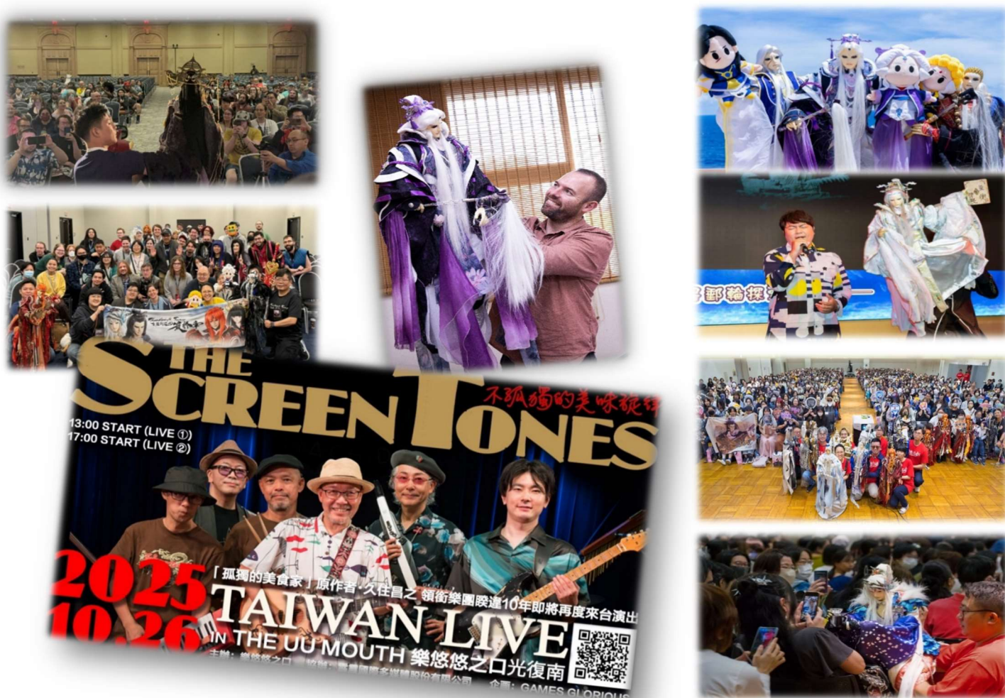
圖5-15 文化藝術傳承-國際交流