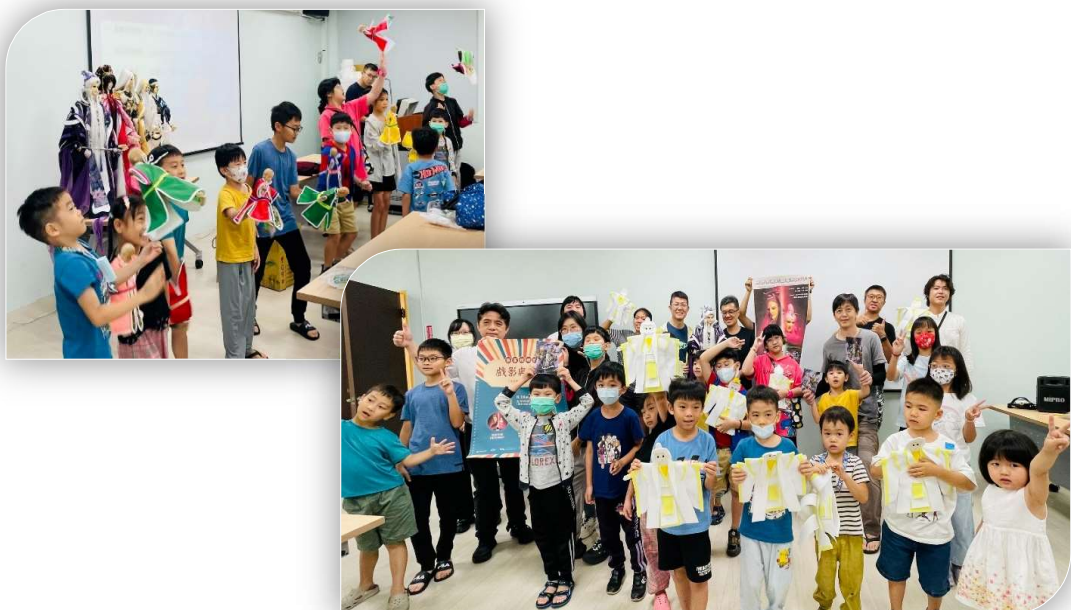
圖5-14 善盡文化傳承、關懷學生學習布袋戲之藝術

霹靂國際致力於文化傳承與教育推廣，積極關懷學生學習布袋戲藝術。2025年8月10日，霹靂前進太平坪林圖書館分館，舉辦布袋戲互動活動，透過精采的表演與手作體驗，讓小朋友近距離欣賞傳統戲偶的精緻工藝與操偶技巧，並親身感受布袋戲的魅力。